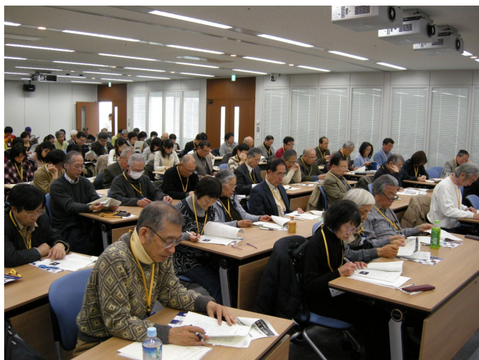
熱心に話を聞く受講者をたち

や鹿児島県のベニクラゲは、他に似通った種類がない独自の遺伝子構造を持つこともわかってきたという。