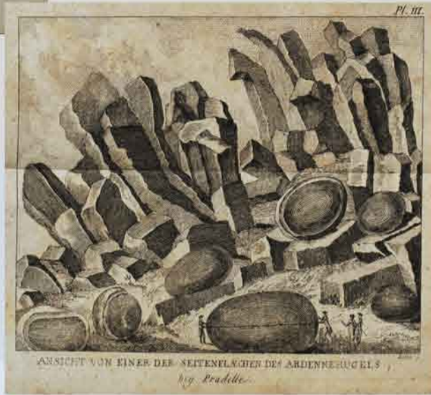
Mineralogie der Vulkane, oder 1786年 (フォジャ・ドゥ・サンフォン『火山の鉱物学』) 理学部中央図書館蔵

Histoire naturelle, generale et particuliere 1785-1791年