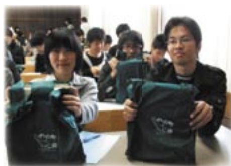
新入生ガイダンス(エコバック)