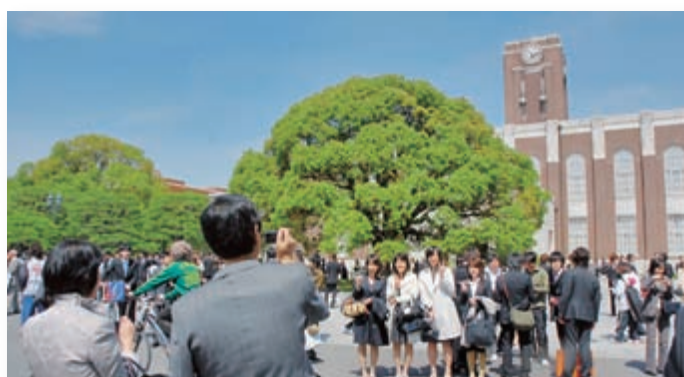
入学式後の時計台前