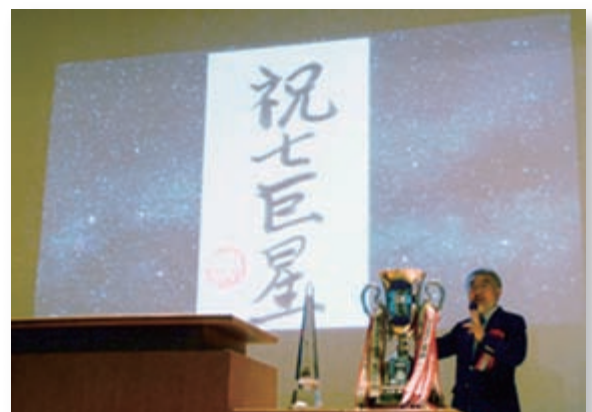
第46回七次戦開会式

(注3) [ ] 書は、社会人特別選抜(大学院設置基準14条特例を含む)による入学者数で内数