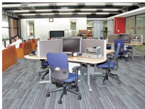
メディアコモン (附属図書館内)