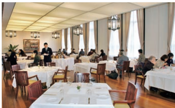
ラ・トゥール（時計台記念館内のフレンチレストラン）