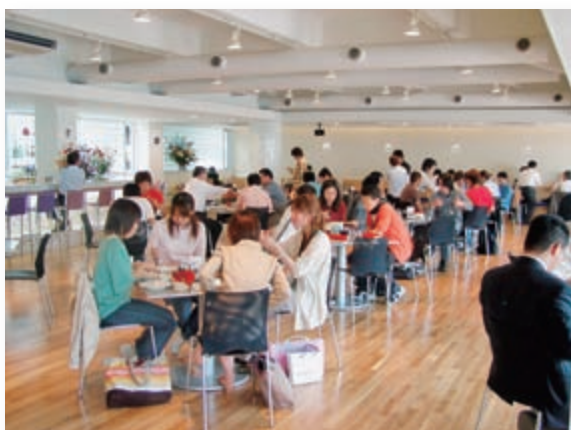
カンフォーラ（正門横のカフェレストラン）