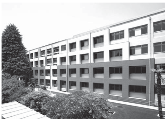
改修工事を行った旧工学部5号館