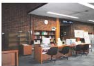
1階メインカウンター