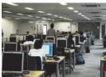
3階情報端末エリア