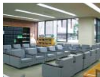
1階新聞閲覧コーナー