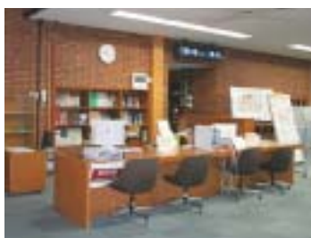
1階メインカウンター