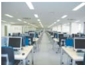
3階情報端末エリア