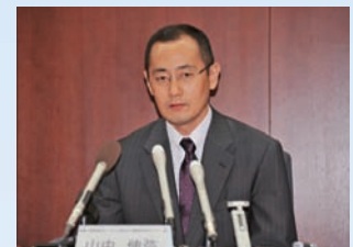
ラスカー賞受賞会見