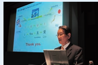
産官学連携欧州事務所開設式