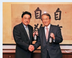
ノンアルコールビール 「サイファーナイル」