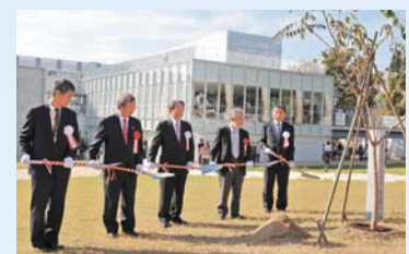
「宇治おうばくプラザ」竣工記念植樹