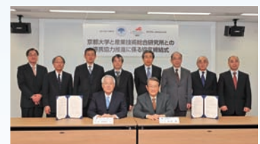
産業技術総合研究所との連携協力