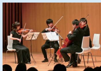
宇治おうばくプラザコンサート開催