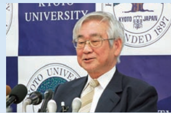
益川敏英名誉教授ノーベル物理学賞受賞会見