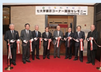
七大学展示コーナー開設セレモニー