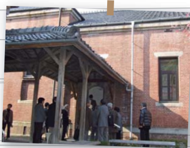
キャンパスツアー