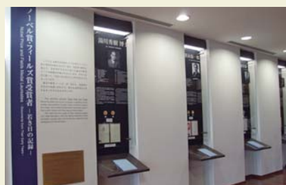
ノーベル賞・フィールズ賞 展示コーナー（桂）