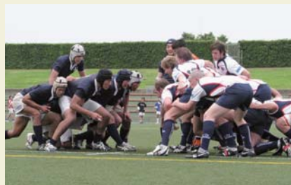
エディンバラ大学ラグビー部と親善試合