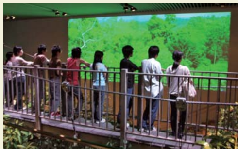
総合博物館（ランビルの森）