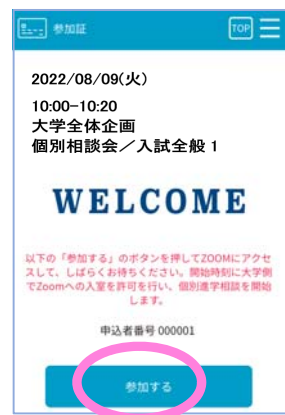
スワイプ後の画面