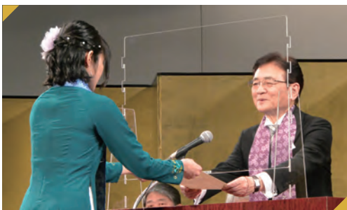
大学院学位授与式