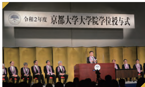
大学院学位授与式