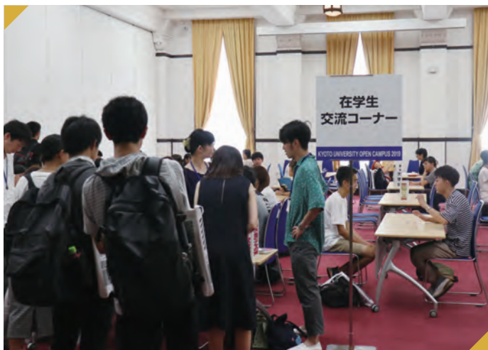
オープンキャンパス