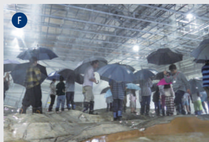
気候変動適応研究センター 宇治川オープンラボラトリー (防)