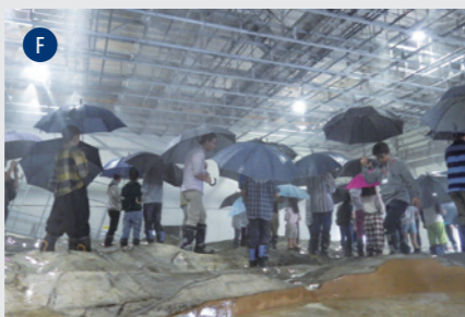
流域災害研究センター 宇治川オープンラボラトリー (防)