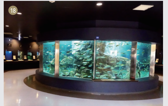
瀬戸臨海実験所(フ)白浜水族館