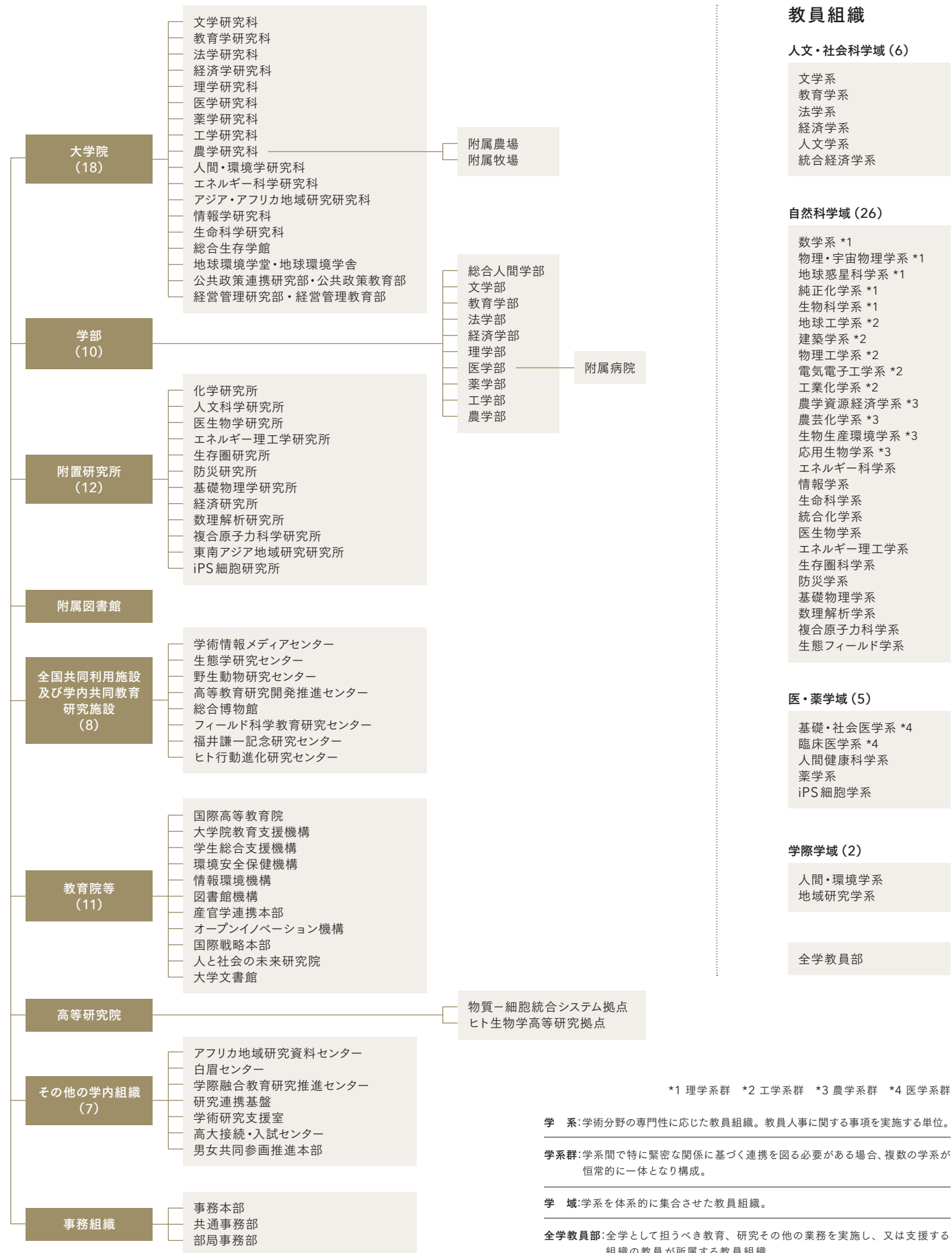
組織図 (令和4年4月1日現在)