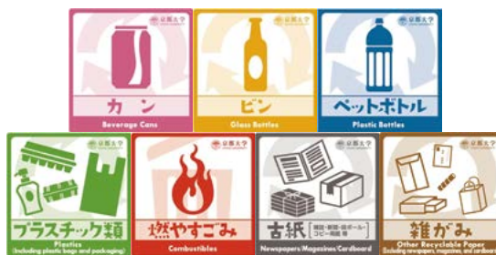
ゴミ分別ステッカー

また、下宿等住まいまでのごみについても、お住まいの自治体の分別方法に従い分別に努めてください。なお、京都市では、新聞やダンボールの他にも「雑がみ (紙箱やメモ用紙、ふせん等)」の分別・リサイクルが条例により義務化されているため、分別によりリサイクルに努めましょう。