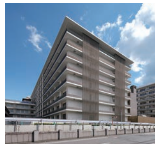
中病棟、次世代医療・iPS細胞治療研究センター