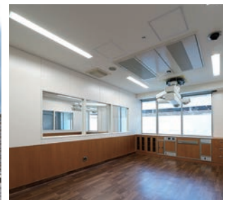
中病棟、次世代医療・iPS細胞治療研究センター