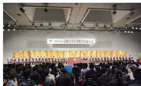
大学院学位授与式