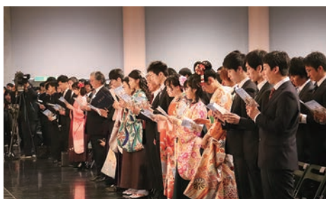
大学院学位授与式