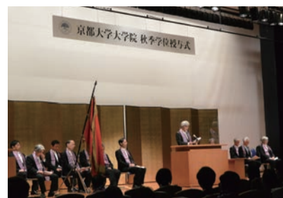
大学院秋季学位授与式