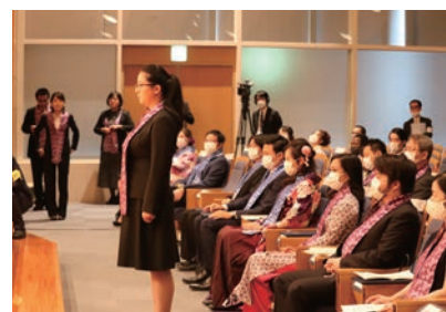
大学院秋季学位授与式

(注1) 人間・環境学研究科の累計には、修士修了相当授与者9名を含む (注2) アジア・アフリカ地域研究研究科は修士修了相当授与者