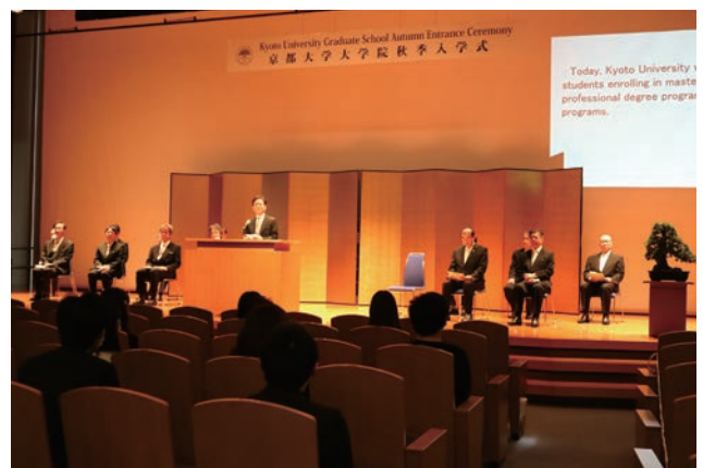
大学院秋季入学式