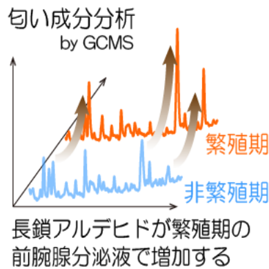
図1 ワオキツネザルのメスを惹き付けるオスの匂いシグナル同定

オスは繁殖期になると、腕の前腕腺（左下：ワオキツネザルオスの全体像と前腕部拡大）を尾にこすりつけ（左上）、メスや他のオスに対してその尾を大きく前後にゆらし（右上：尾ゆらし行動）。前腕腺分泌液をガスクロマトグラフ質量分析装置で成分分析すると、12-メチルトリデカナールを始めとする三種類の長鎖アルデヒド化合物が繁殖期に有意に増加していることが分かりました（右下図）。そして、メスは、同定されたアルデヒド化合物群の匂いに興味をもってよく嗅ぐことが明らかになりました。