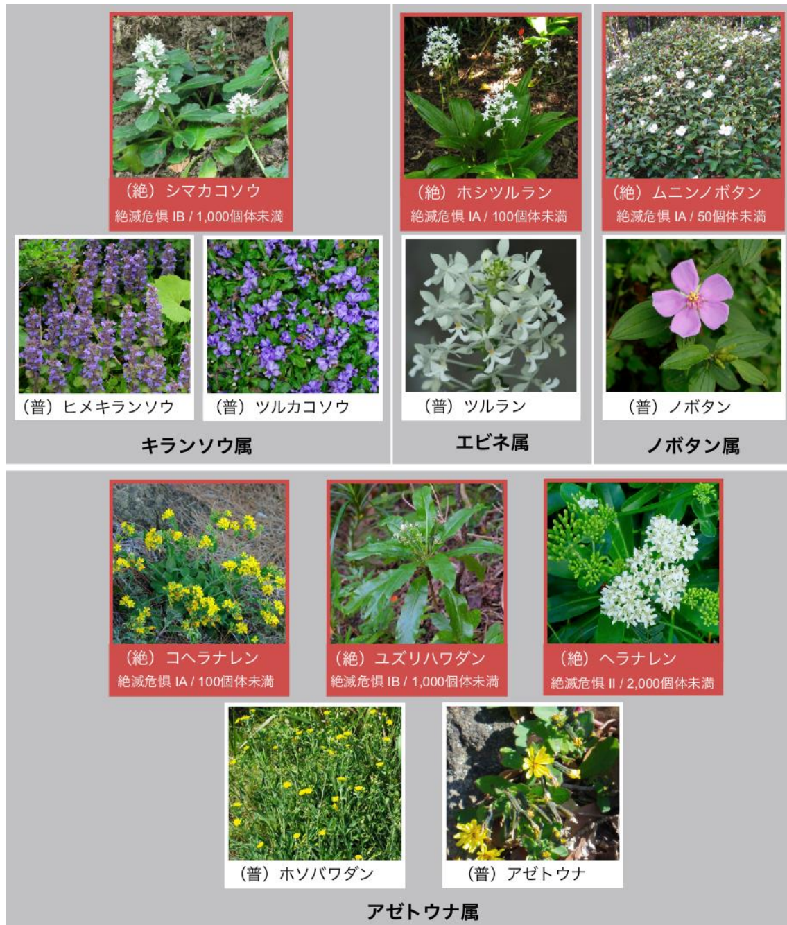
図 1. 本研究で解析を行った(絶)小笠原産絶滅危惧種と(普)広域に分布する普通種 個体数は推定の野生生育数を示しています。