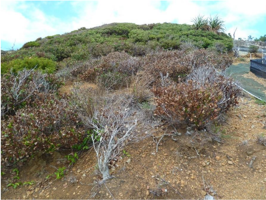
図1：この研究をするきっかけとなった小笠原の固有種の樹木の大量乾燥枯死