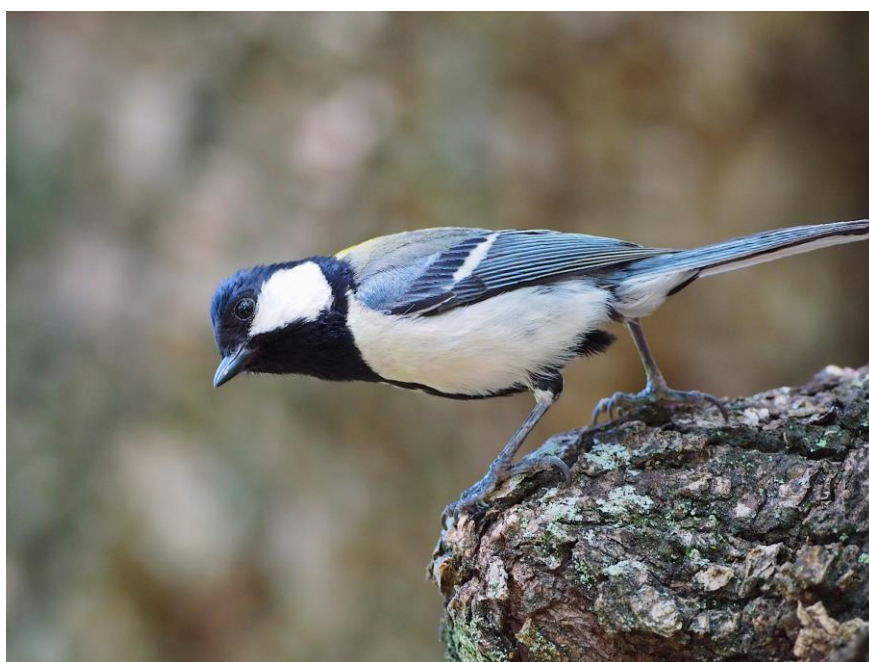
ヘビ特異的な鳴き声を聞き、ヘビを探すシジュウカラ

従来、動物のコミュニケーションは、話し手が聞き手の行動を機械的に操作する「命令」であると考えられてきました。それに対して、本研究は、鳥類の鳴き声が聞き手にその指示対象のイメージを想起させることを実験的に証明しました。「リンゴ」と聞くと、目の前にリンゴがなくても、赤いリンゴを頭に思い描くように、シジュウカラも「ヘビ」を示す鳴き声からヘビをイメージできるのです。私たちの言語コミュニケーションを可能とする様々な認知能力は、実は他の動物においても広く進化しているのかもしれない。