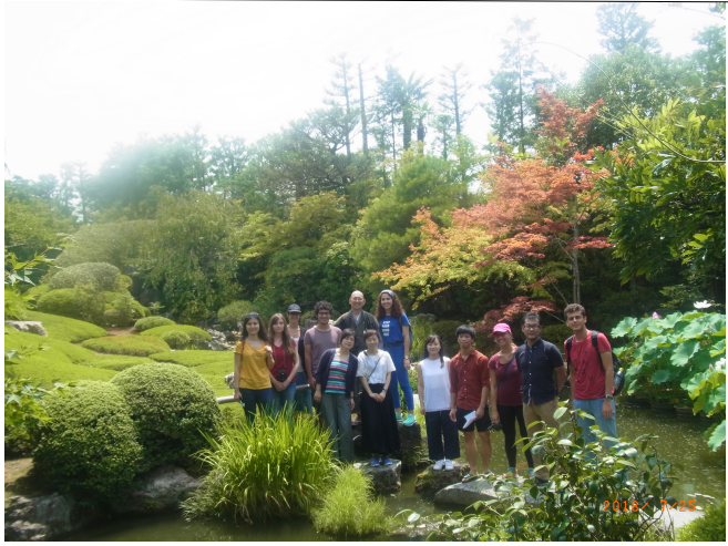
禅体験後の記念撮影