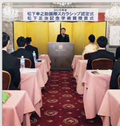
松下正治記念学術賞として出版