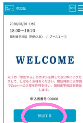
スワイプ後の画面