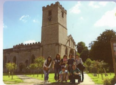
オックスフォード大学特別サマープログラム

協定校や海外の大学等と教育連携し、現地で2～3週間の大学生活を体験しながら世界に通用する英語能力の向上およびコミュニケーション能力の養成を目指します。参加者の語学習得状況に合わせて複数のプログラムが用意されています。英語能力に不安のある場合でも参加しやすいプログラムも用意されています。