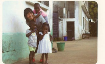
おもろチャレンジ

本学学生が、自主的に計画をした渡航計画で行う、海外での研究活動や課外活動、奉仕活動等の支援付き留学プログラムを実施しています。渡航期間、渡航国、留学内容等は、全て学生が計画し、自主的な行動が求められます。