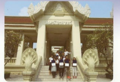
チュラーロンコーン大学サマープログラム

本学学生が各国の大学生と、現地で交流を深め、国際性を養い、外国語運用能力を向上させる機会として、提供されています。語学学習、教員による特別講義、現地学生との共学、フィールドトリップ等、カリキュラムは先方大学との協力の下で開発されており、充実した内容になっています。