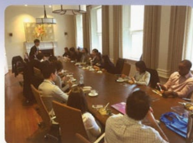
Kingfisher Global Leadership Program

大学連携組織等が主催の留学プログラムや業者主催のインターンシッププログラム等も提供しています。海外の学生と英語での討論を行う機会や、現地の企業・機関等を訪れる機会が設けられています。