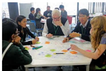
ウインタースクールでのグループディスカッション