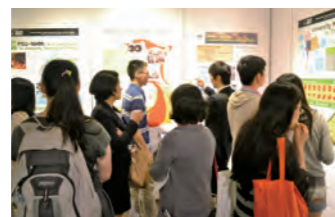
博物館シンポでのポスターセッション（国立台湾大学）

Multi-Hazards Summer School Undergraduate Summer Program Doctoral Students Conference