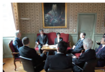
山極総長とハイデルベルク大学学長との会談

博士課程学生サマースクール 2014年9月 カールスルーエ工科大学 博士課程学生 3 名参加、教員 2 名が講師として参加 次回はゲッチンゲン大学で開催予定