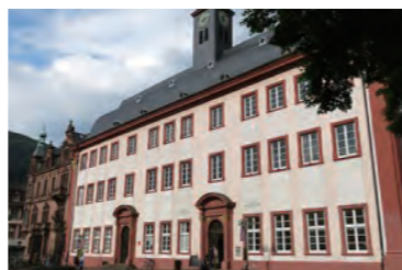
ハイデルベルク大学構内、京大のオフィスが入る校舎

2013年、本学の海外拠点の1つ、欧州拠点ハイデルベルクオフィスはハイデルベルク大学内に開所。2015年には本学内にハイデルベルク大学のサテライトオフィスが開所。双方がスタッフを現地に派遣し、今後も研究・教育の連携を強めていく。研究セッション、学生用スクール、共催シンポジウムなどを実施予定。