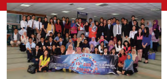
学生フォーラム&スピーチコンテスト（マレーシア国民大学）

AUN and ASEAN+3 Educational Forum and Young Speakers' Contest (学部生)