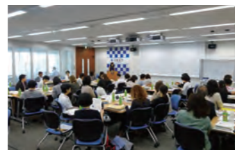
APWIL ワークショップ（京大東京オフィス）

Chief Information Officers Forum & Education and Research Technology Forum Research Symposium on University Museums Asia-Pacific Women in Leadership (APWIL) Workshop