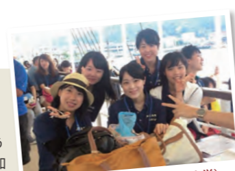
サマーキャンプ2014（大阪大学）