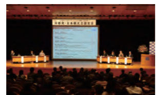
公開シンポジウム (京都)