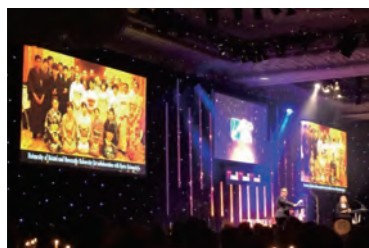
ロンドンでの授賞式で紹介される京都大学でのプログラムの一部

2013年にRENKEIの初のプロジェクトとして、京都大学、プリストル大学主催により開催した、RENKEI Researcher Development School in Bristol and Kyoto 2013は、英国における若手研究者育成に対する顕彰としては最も評価の高い、Times Higher Education Outstanding Support for Early Career Researchers 賞のファイナリストに選考された。