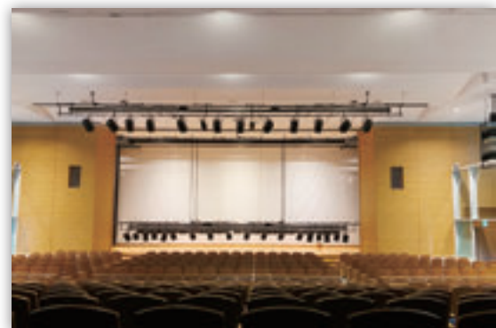
百周年記念ホール