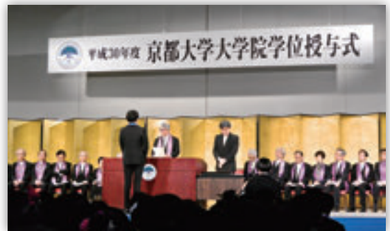
大学院学位授与式