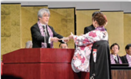
大学院学位授与式