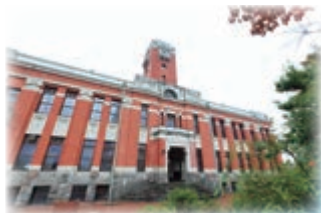
地球熱学研究施設