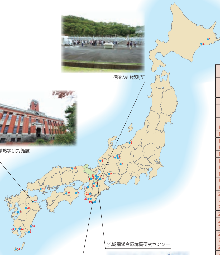
流域圏総合環境質研究センター