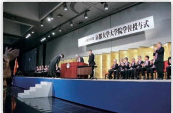
大学院学位授与式