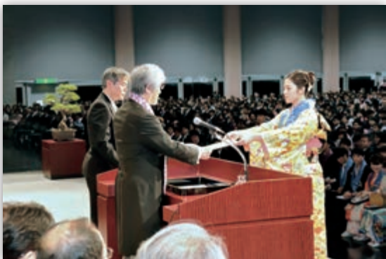
大学院学位授与式