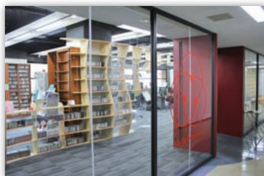
メディアコモンズ