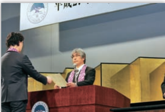
大学院学位授与式