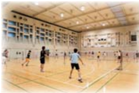
バドミントン部練習の様子