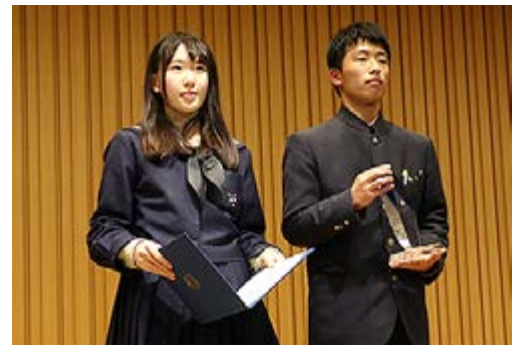
総長賞を受賞した和歌山県立向陽高等学校