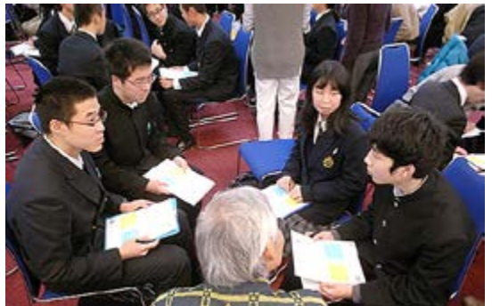
参加者同士による意見交換