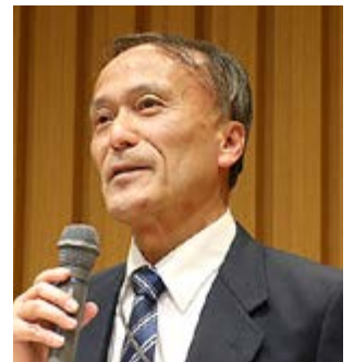
江島特定教授による全体講評