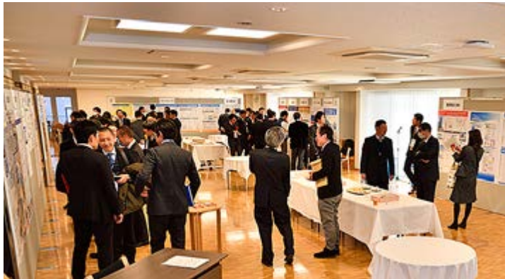
ポスターセッションの様子

シンポジウム前半は「中国・上海の大学キャンパス省エネ実証事業」および「IoTによる省エネとコミュニティエネルギーの進化」と題した2件の基調講演が行われ、後半のポスターセッションでは、18団体より30を超えるポスターが出展され、「環境配慮」、「省エネ」、「減災」の各分野において発表者、参加者全員による活発な議論や意見交換が行われました。