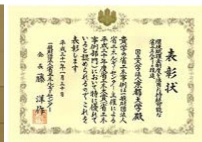
省エネ大賞表彰状