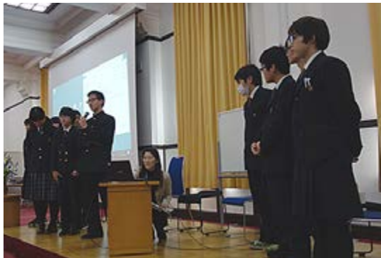
高校生によるポスター紹介

参加者からは、「協働対話型というのは初めてで他の参加者との意見交換は新鮮だった」、「高校生のポスターセッションはとてもよかった」、「高校1年生から70代の方まで幅広い意見が聞けてよかった」などの感想が寄せられ、盛況のうちに閉会しました。