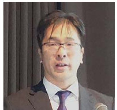
特別講演を行う柴教授