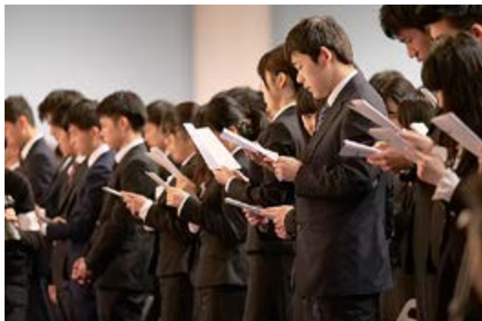
学歌を斉唱する入学生