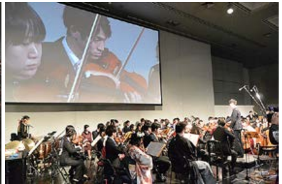
京都大学交響楽団による演奏