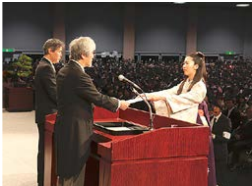
山極総長から学位記を受け取る学部代表