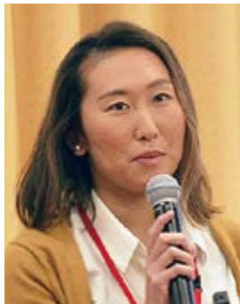
武知アンバサダー