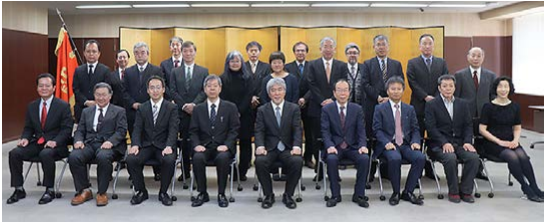
出席された被表彰者との集合写真