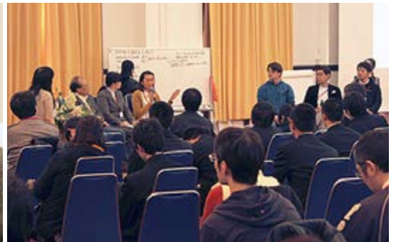
パネリストによるセッションの様子