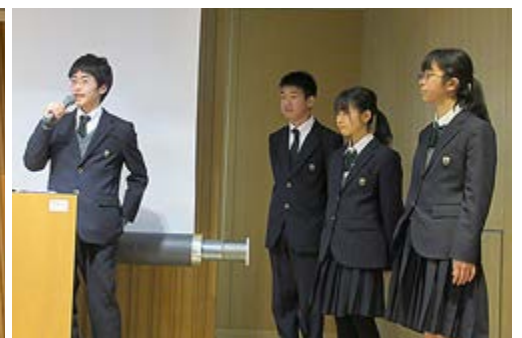
副学長賞を受賞した大阪府立豊中高等学校