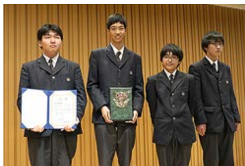
副学長賞を受賞した兵庫県立明石北高等学校