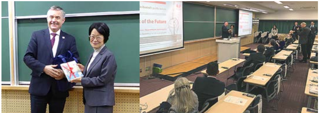
記念品を交換するフーベルト・ハイッス駐日オーストリア大使と稲葉カヨ理事・副学長