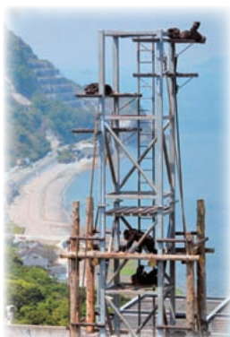
チンパンジー・サンクチュアリ・宇土