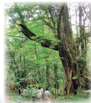
森林ステーション・菅生研究林