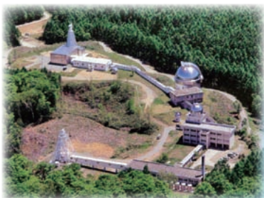
附属天文台 [飛騨天文台]