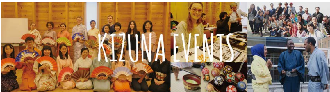
きずな月例イベントの様子

「きずな」の詳細は下記のHPを参照してください。また、Twitterでも最新情報が閲覧できます。