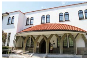
37 楽友会館・レストラン「近衛 Latin」