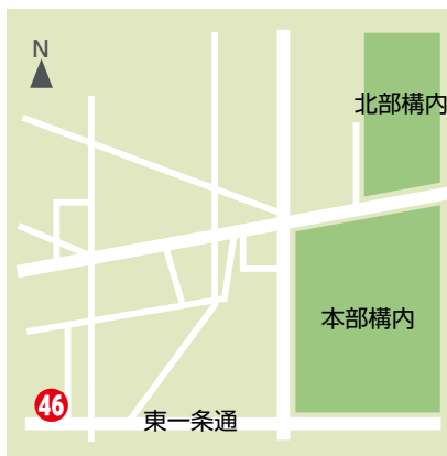
46 総合生存学館教務掛