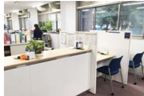
⑨教育推進・学生支援部学生課奨学掛