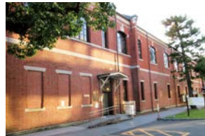
⑩教育推進・学生支援部棟 (P12フロアマップ)