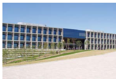
⑥1 工学研究科大学院掛・留学生掛