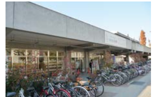
⑫カフェテリアルネ ショップルネ