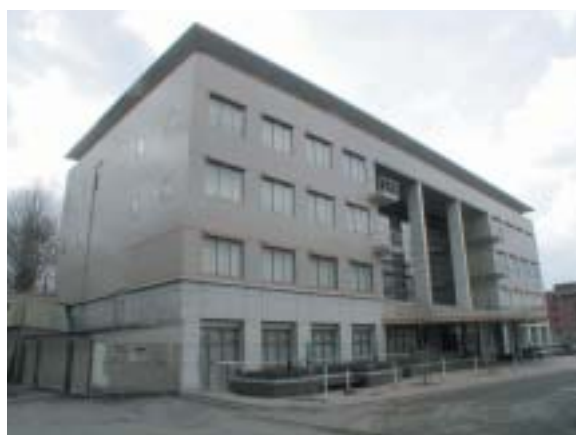
学術情報メディアセンター南館 (OSL) 建物

また、教育用コンピュータシステムではPCやファイルサーバ、プリンタなどは限られた資源を多くの利用者が共同で利用しています。他の利用者に配慮し、許された利用条件の範囲で有効に利用してください。設備やソフトウェアは貸借物品ですので大切に扱ってください。機器やソフトウェアについては保守や更新を行っています。必ずしも個人の希望に沿った新規導入などができるわけではないことにもご理解ください。