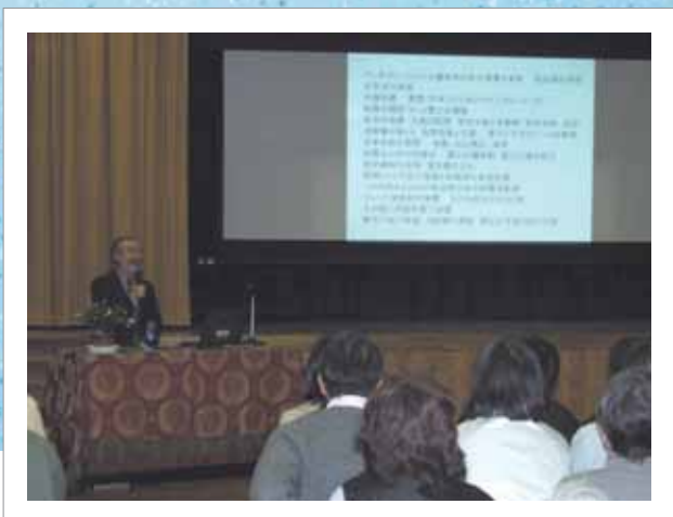
「安心安全のまちづくり研修会」(主催:京都市立第四錦林小学校ほか)での講演「私たちのくらしと花折断層」の様子 (2005年12月1日 京都市立第四錦林小学校)