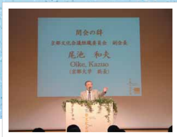
京都文化会議2004（主催：京都文化会議組織委員会）にて （2004年10月31日 京都大学百周年時計台記念館）