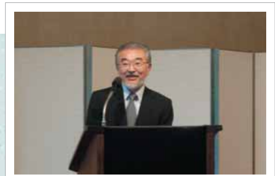
「持続可能な社会のための科学と技術に関する国際会議2006」(主催:日本学術会議ほか)の「ランチセッション」におけるスピーチ (2006年9月9日 国立京都国際会館)