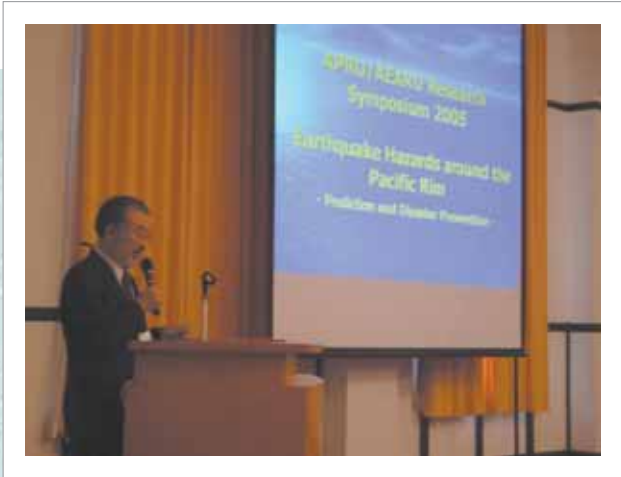
APRU/AEARUリサーチシンポジウム「環太平洋地域における地震危険度—その予測と防災—」での講演の様子 (2005年8月31日 京都大学百周年時計台記念館)