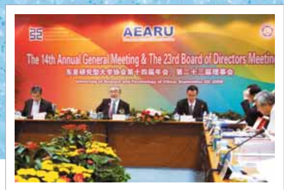
第14回AEARU総会・第23回理事会(ホスト校:中国科学技術大学)での議事主宰の様子 (2008年9月19日 中国)