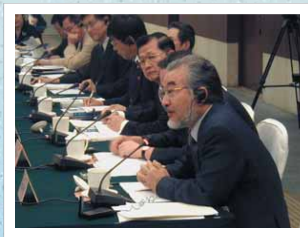
第3回日中中学長会議にて（2004年8月2日 中国）