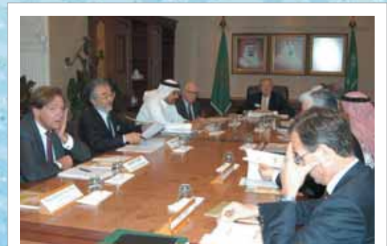
サウジアラビアのキング・ファハド石油鉱物資源大学IAB (国際アドバイザーボード)の会議にて (2007年3月11日 サウジアラビア)