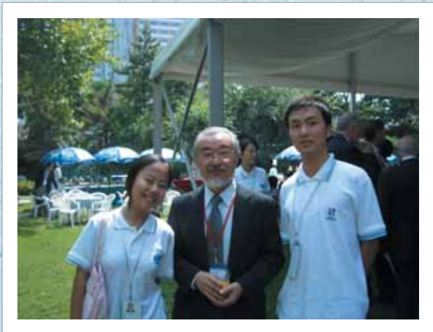
中国の復旦大学百周年記念式典における日本語学部学生との記念撮影 (同大学日本研究センターの庭で) (2005年9月25日 中国)