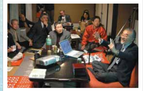
町屋DEサロン第10回での講演「地震を知って震災に備える」の様子 (2007年1月12日 京都市中京区の町屋)