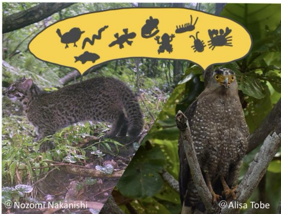
イメージ図：イリオモテヤマネコ（左）とカンムリワシ（右）

本研究では、小島嶼である西表島に食物連鎖のトップとして同所的に生息し、餌品目も共通するとされていたイリオモテヤマネコとカンムリワシの、餌資源を巡る競合に着目しました。2種の食性を、従来の手法より解像度が高いと期待される DNA バーコーディング法 1 により解析した結果、両種から検出された餌品目は異なる特徴を示し、2種が資源をうまく使い分けることで小さな西表島での共存が可能になっていることが示唆されました。西表島のアンブレラ種 2 である2種の共存機構の一端を解明し、今後の保全にも繋がる成果となりました。本研究成果は、2024年4月2日に国際学術誌「Scientific Reports」にオンライン掲載されました。