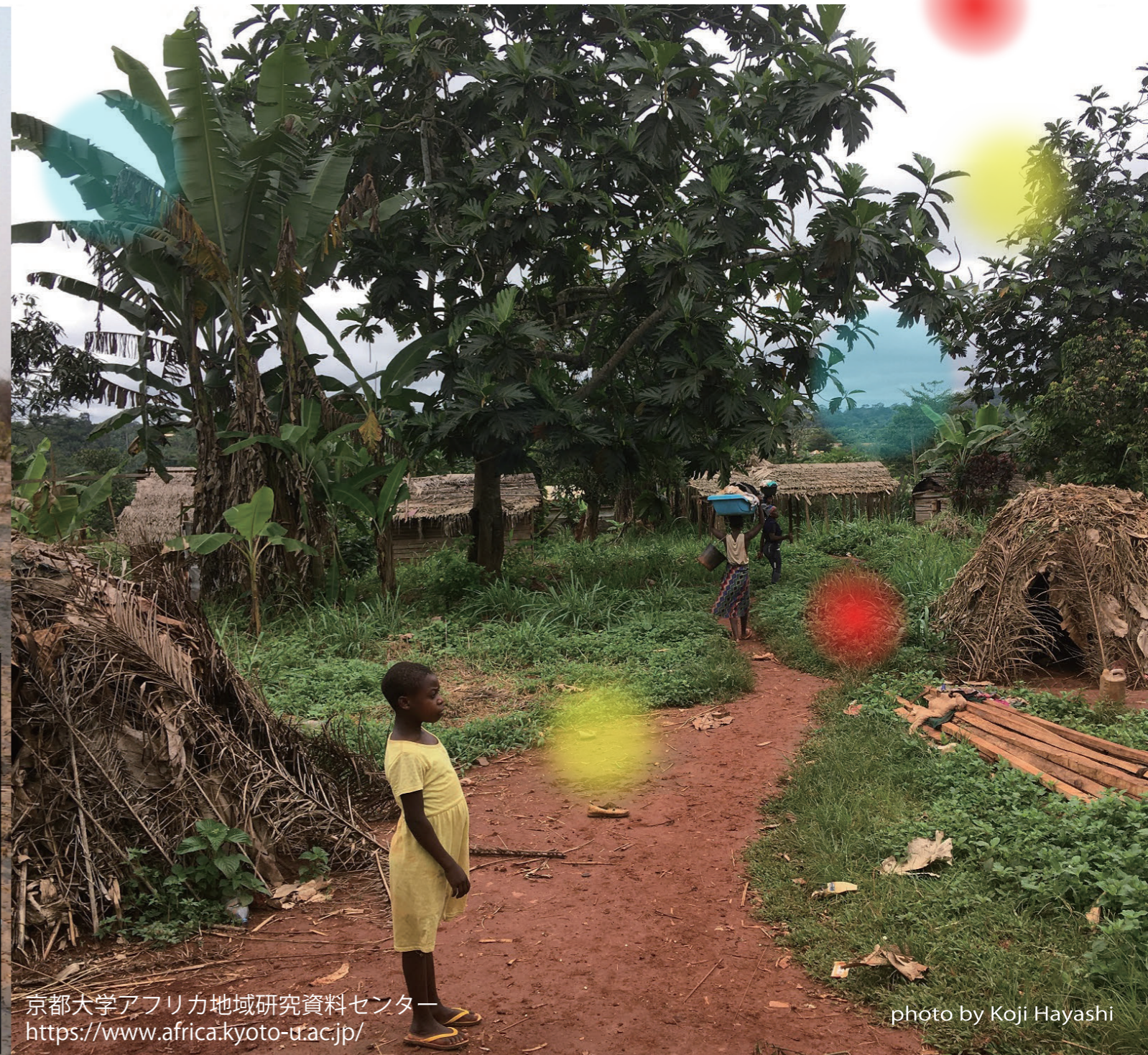
京都大学アフリカ地域研究資料センター https://www.africa.kyoto-u.ac.jp/