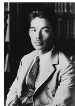
木原均 Hitoshi Kihara (1893-1986)

お問い合わせ：京都大学農学研究科 応用生物科学専攻 植物遺伝学分野事務室 TEL：075-753-6145