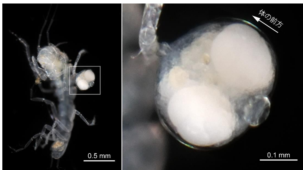
深海性ワラジムシ類に寄生する Diexanthea hakuohmaruae のメス