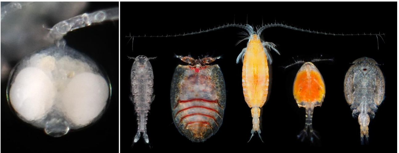
図 1. Diexanthea hakuohmaruae のメス (左) と様々なカイアシ綱甲殻類 (右)。