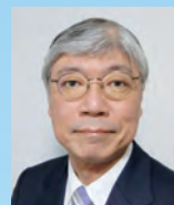
中西 寛 京都大学大学院 法学研究科 教授