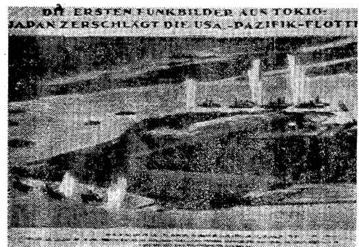
ドイツ紙に掲載された真珠湾攻撃の写真 （『東京日日』1942年1月24日）