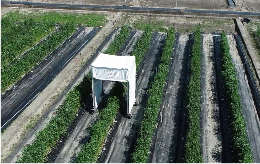
図1. 今回開発した高速フェノタイプングローバーを実際に野外で運用している様子。