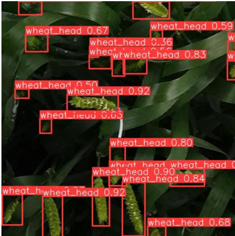
図2. 試験運用において撮影した画像からコムギの出穂の様子が測定できた。